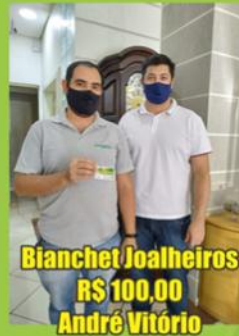
Bianchet Joalheiros R$ 100,00 André Vitorio