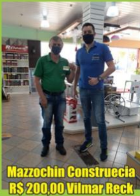
Mazzochin Construecia R$ 200,00 Vilmar Reck