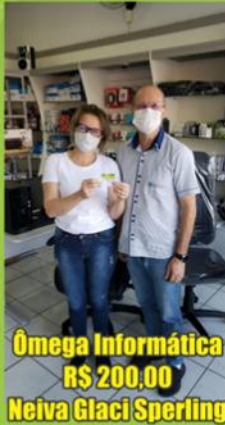
Ômega Informática R$ 200,00 Neiva Glaci Sperling