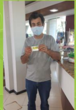
Maffini Material Construção R$ 100,00 Luis Ribeiro